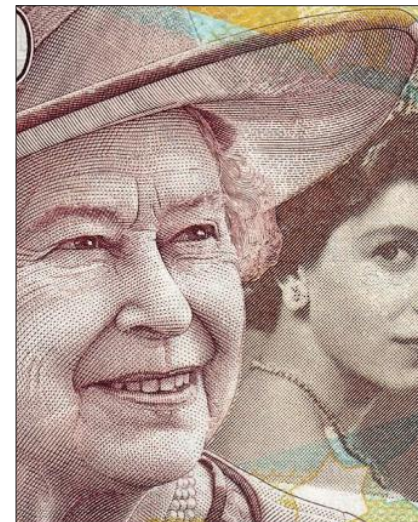
Miss Juni: Queen Elizabeth II.

den Buchhandlungen Hugendubel, Diel und Pustet und dem Reformhaus Lapper erhältlich, außerdem in Furth bei Schreibwaren Biedermann und in Vilsbiburg in der Buchhandlung Koi. (red)