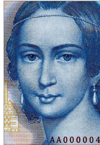
Miss Juli: Clara Schumann

Der Kalender „Frauenporträts auf Banknoten“ ist für 20 Euro in Landshut im Leserservice der „Landshuter Zeitung“ sowie bei